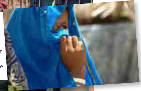
Pakistan Désespoir caché derrière le voile