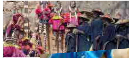
Mali Culte animiste