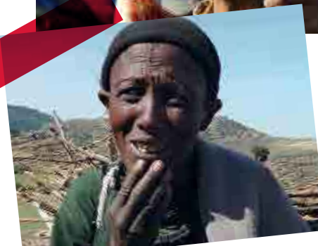
Éthiopie Davantage qu'une pauvreté matérielle