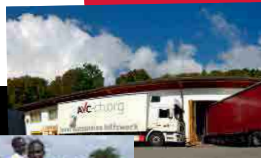
600 tonnes de matériel La base du CACP en Suisse L'un des centres logistiques

pour les enfants leur permettent un bon développement et de recevoir une formation.