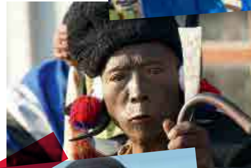
Nord-Est de l'Inde Anciens chasseurs de primes. Sinistres personnages