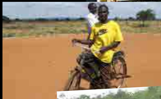
1000 évangélistes Par exemple en Éthiopie