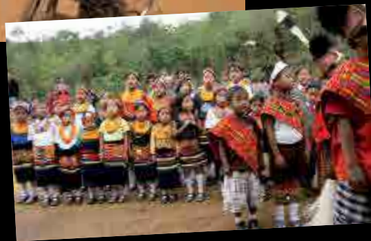
9000 parrainages Jusqu'aux extrémités de la terre, comme dans le Nord-Est de l'Inde