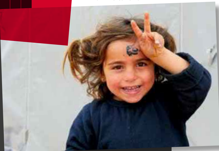
Reguläre Spenden AVC