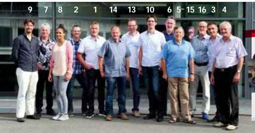
Neu im Team 2016/2017

Die Berechnung bezieht sich auf Finanzspenden; die zusätzlichen geschätzten CHF 5 770 000.- an Sachspenden sind nicht berücksichtigt.