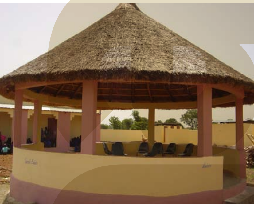
Adapter l'architecture traditionnelle Espace de loisir

De plus, Néhémie Mali a mené plusieurs actions humanitaires et s'est concentré sur l'affermissement des nouveaux chrétiens.