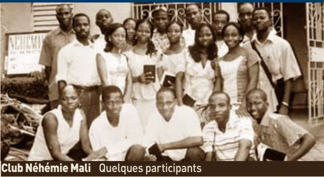
Club Néhémie Mali Quelques participants