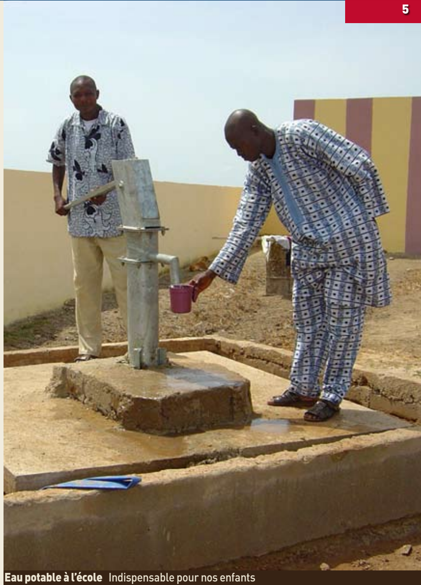
Eau potable à l'école Indispensable pour nos enfants

Aujourd'hui je me réjouis dans le Seigneur car selon la Parole de Dieu « si quelqu'un est en Christ, il est une nouvelle créature, les choses anciennes sont passées, et voici toutes choses sont devenues nouvelles ». Je rends grâce au Seigneur Jésus et je remercie les initiateurs de ces rencontres. »