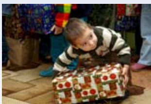
... est occasionnellement ...

équipe de volontaires ayant confectionné des paquets s'est rendue sur place en Moldavie. En collaboration avec des églises locales, les paquets ont été remis à des hommes, des femmes et des enfants. Ils les ont distribués dans des écoles, des jardins d'enfants, dans des logements misérablement équipés, et ailleurs encore.