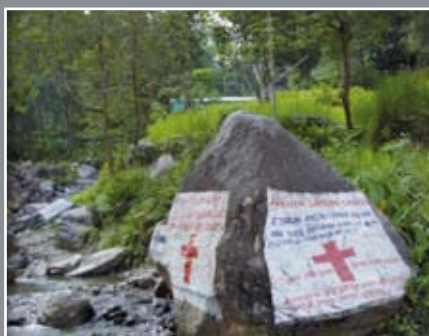
Une croix rouge peinte sur une pierre Poteau indicateur vers une clinique très spéciale

A cinq heures de route de Katmandou, la capitale du Népal, se trouve une petite église très spéciale : quand arrive « l'heure des consultations », comme dans une clinique, Dieu agit par des miracles étonnants. Voici ce que vivent quotidiennement beaucoup de chrétiens népalais.