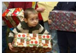
... tellement important