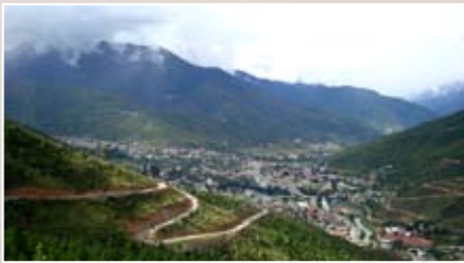
Thimphu Vue générale sur la capitale du Bhoutan

L'implantation d'églises au Royaume du Bhoutan peut être lourde de conséquences pour nos collaborateurs autochtones. Le CACP s'y investit depuis 11 ans, et le travail porte ses fruits.