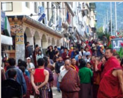
Thimphu Le centre ville est très animé

Dans ce royaume bouddhiste-lamaïste, changer de religion était jusqu'à tout récemment une infraction pénale. Dans les vallées reculées des différentes provinces, la levée de l'interdiction s'est faite lentement alors que l'Évangile s'y propageait rapidement. Cela a coûté très cher à un grand nombre de chrétiens : Discrimination et persécution à grande échelle – Maisons incendiées – Expulsions – Perte de l'emploi – Arrestations – Interrogatoires etc.