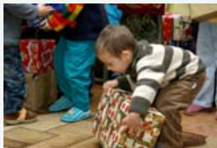
Inestimable procurer la joie...

Quatre organisations humanitaires chrétiennes, des centaines d'églises, d'écoles et diverses communautés, ainsi que des milliers d'individus et de familles ont consciencieusement préparé cette action. Les paquets ont été rassemblés dans 450 centres de collecte, et ont été acheminés vers les pays de l'Est de l'Europe au moyen de 21 convois routiers.