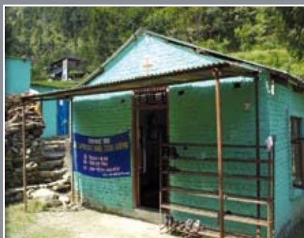
Une église modeste Son influence s'exerce dans toute la région

« Les aveugles voient, les boiteux marchent, les lépreux sont rendus purs, les sourds entendent, les morts reviennent à la vie, et la Bonne Nouvelle est annoncée aux pauvres ». (Luc 7 : 22)