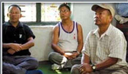
Une prière fervente et passionnée Des malades incurables sont guéris