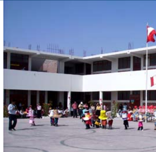
L'école base d'un vrai changement