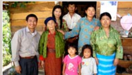
Une église de maison Petite mais efficace

contexte que la foi s'affermait et devient puissante. Les personnes liées par les pratiques occultes sont délivrées. Elles expérimentent la puissance du sang de Jésus, puis commencent une nouvelle vie. Parmi ces nouveaux chrétiens, il y a d'anciens sorciers qui avaient jeté des mauvais sorts aux autres, se plaisant à les tourmenter pendant des années.