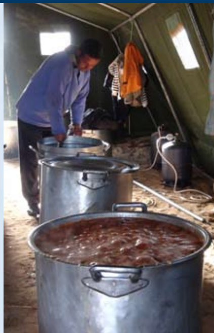
Des chrétiens locaux au cœur de l'action