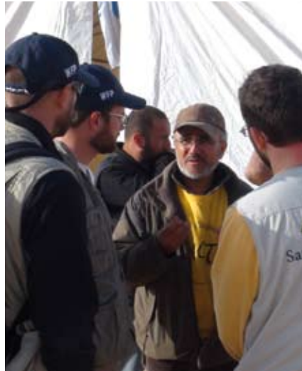
Des chrétiens engagés au camp de Choucha