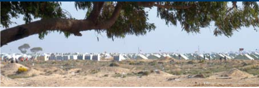
Des tentes à perte de vue