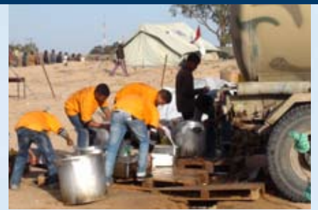
L'eau potable arrive en camions citernes